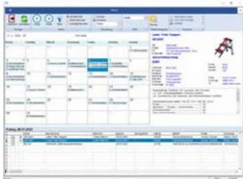
Monatskalender aller Aufgaben →