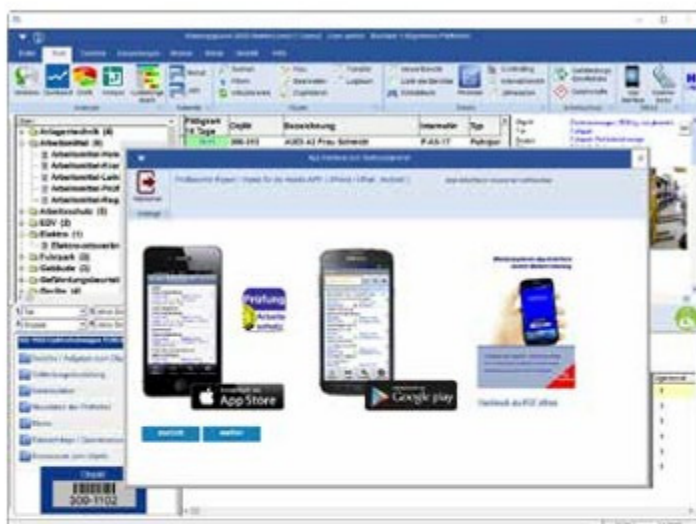
➤ Mobile Erfassung mit dem Wartungsplaner