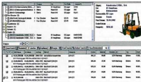
Bild 1: EDV-gestützter, übersichtlicher und einfach zu handhabender Wartungsplaner